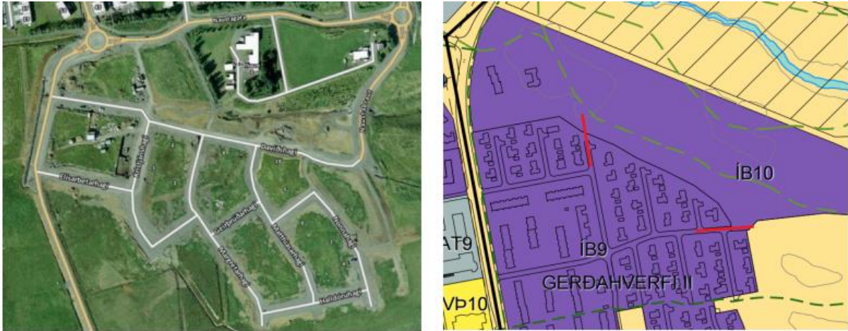
Mynd 2: Til vinstri er Hagahverfi á Akureyri sem dæmi um hönnun hringtenginga í nýjum hverfum og til hægri eru sýndar líklegar tengingar við nýverandi íbúðabyggð. Nýja íbúðahverfið er skipulagt með anga sem nær sérstaklega að Stóragerði til að geta tengst þar við.