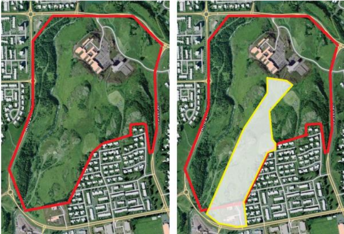
Mynd 3: Athugunarsvæðið er innan rauðu útlínanna. Á myndinni til hægri er búið að merkja inn áætlaða íbúabyggð. Sést vel hvernig byggðin sker í sundur útivistarsvæðið.

Á næstu blaðsíðu má sjá töflu yfir þær fuglategundir sem sést hafa á athugunartímanum. Er þeim skipt upp í þrjá flokka: